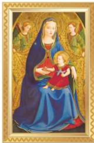
La Virgen de la granada. Fra Angelico. Museo Nacional del Prado, Madrid.

LEMBRATE DE MERCAR UNHA PARTISIPACIÓN DO NÚMERO OFICIAL QUE REPARTIRÁ DUSIAS DE MILLÓNS NO SORTEO DE NAVIDÁ