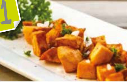
Braves amb salsa de foie